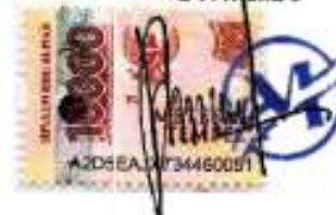
PHILIPUS NORBERTUS NAIKOFI Direktur