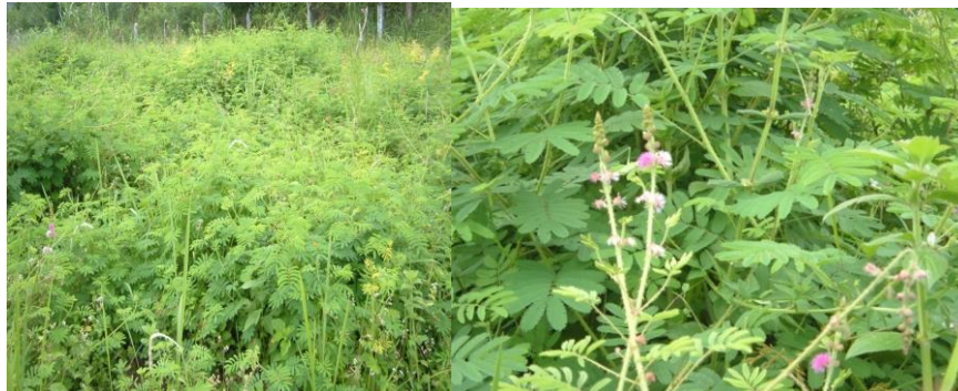
Gambar 13. Mimosa invisa

( Calopogonium mucunoides ), dan bunga kuning widelia, dapat dilihat bentuk dan bunga pada gambar berikut.;