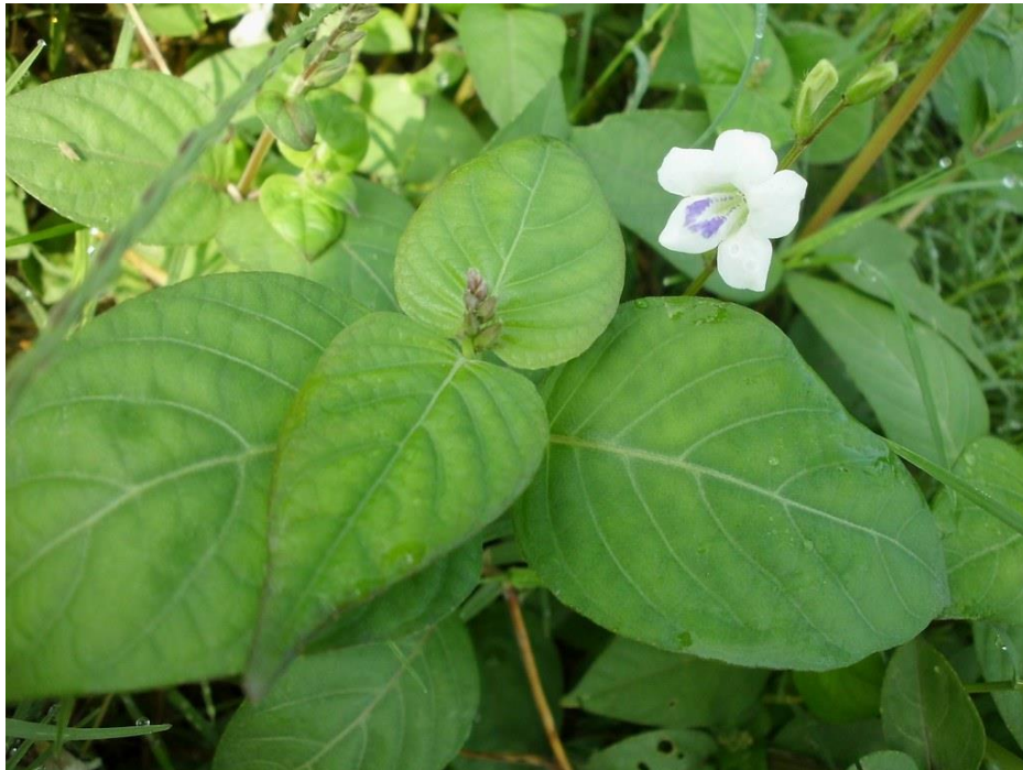
Gambar 11. Ara Sunsang ( Asystasia gangetica )