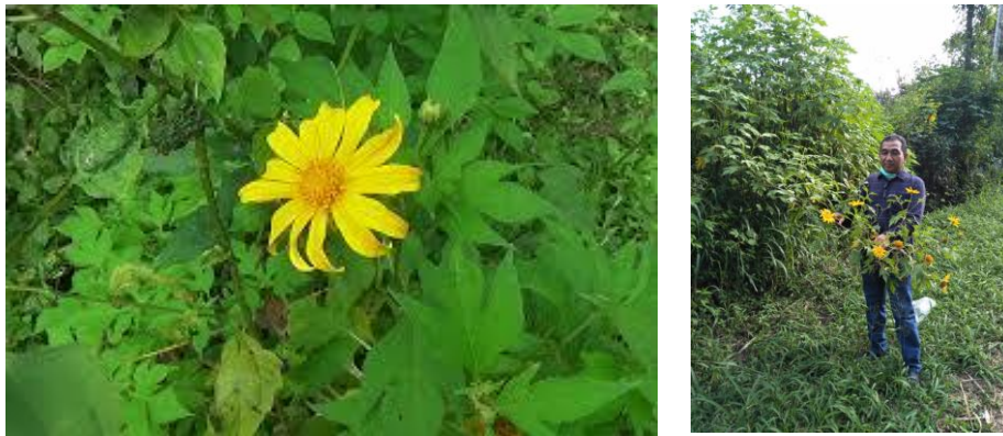
Gambar 5. Bunga Matahari Meksiko ( Thitonia diversifolia )