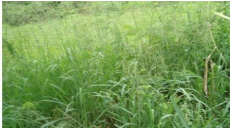
Gambar 1. Rumput Benggala ( Panicum maximum )