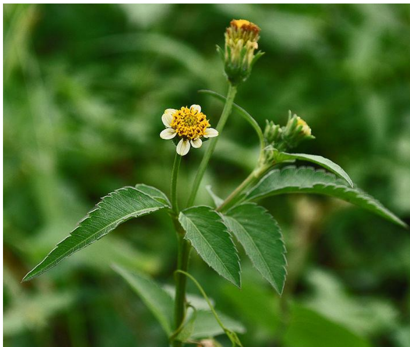
Gambar 6. Ketul ( Biddens Spilosa )