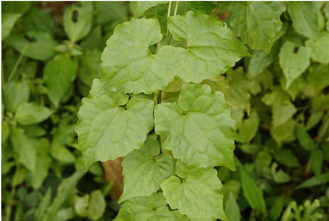
Gambar 9. Sambung rambat ( Micania Scandens )