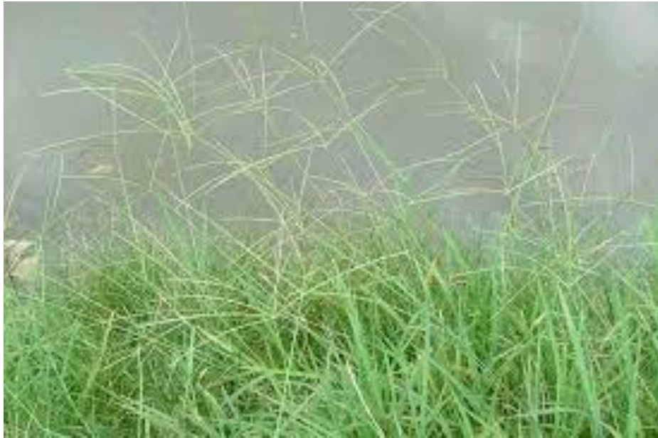
Gambar 7. Rumput Pangola ( Digitaria Sp )