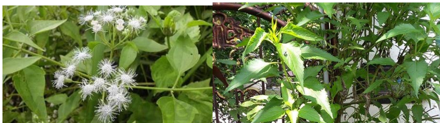
Gambar 17. Bentuk bunga dan daun gulma kirinyuh

Kirinyuh mengandung unsur hara yang tinggi yakni 2,42% N, 0,26% P dan 1,6% K dan dapat menyuburkan tanaman serta mampu meningkatkan pertumbuhan. Bentuk daun dan bunga dari tanaman kirinyuh dapat dilihat pada gambar 2 berikut;