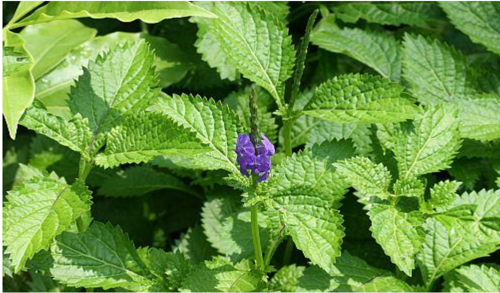
Gambar 3. Pecut Kuda ( Stachytarpheta jamaicensis )