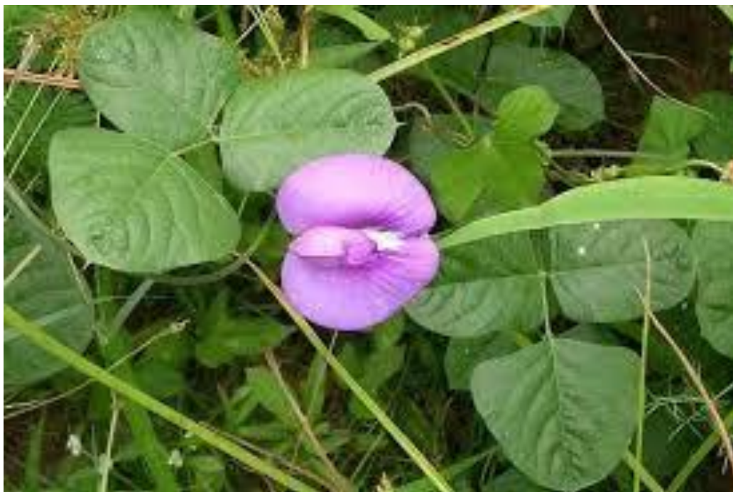
Gambar 10. Centosema pubecens