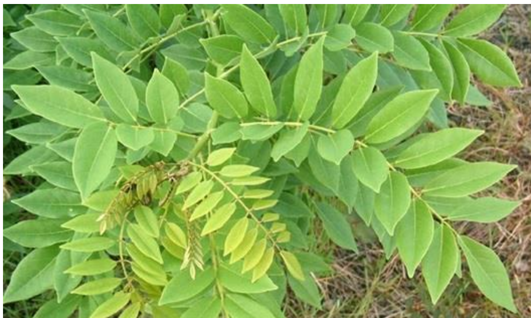
Gambar 12. Gamal ( Gliricidia sepium )