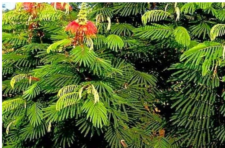
Gambar 2. Kaliandra ( Calliandra calothyrsus )