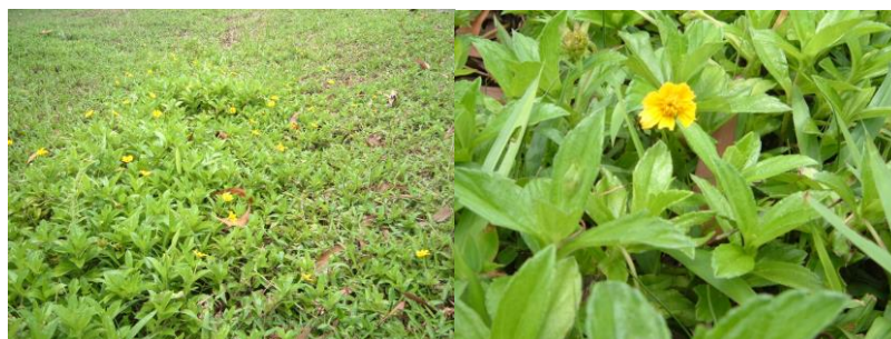
Gambar 15. Bunga Kuning ( Widelia )

Pengelolaan hara terpadu antara pemberian pupuk dan pembenah akan meningkatkan efektivitas penyediaan unsur hara, serta menjaga tanah agar tetap berfungsi lestari. Kesuburan tanah tidak terlepas dari keseimbangan biologi, fisika dan kimia. Ketiga unsur tersebut saling berkaitan dan sangat menentukan tingkat kesuburan lahan pertanian.