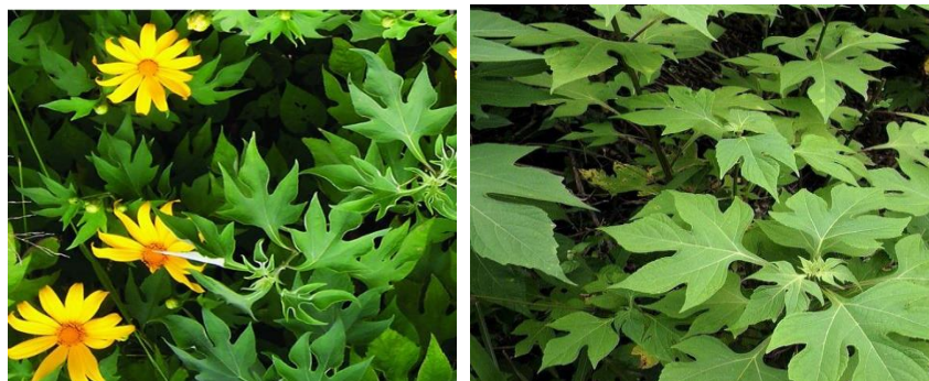
Gambar 16. Bentuk daun dan warna bunga dari gulma Tithonia

Buahnya berbentuk kotak, bulat, buah muda berwarna hijau dan buah tua berwarna cokelat. Biji berbentuk bulat, keras, dan berwarna cokelat. Tanaman ini berakar tunggang dan berwarna putih kotor. (Lestari, 2016). Bentuk dan warna dari bunga tithonia dapat dilihat pada gambar berikut ini.