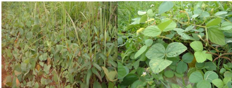
Gambar 14. Calopogonium mucunoides

Tanaman pupuk hijau, utamanya dari famili leguminosa, memiliki kandungan hara nitrogen yang tinggi. Leguminosa sebagai pupuk lebih mudah terdekomposisi, sehingga penyediaan hara bagi tanaman lebih cepat