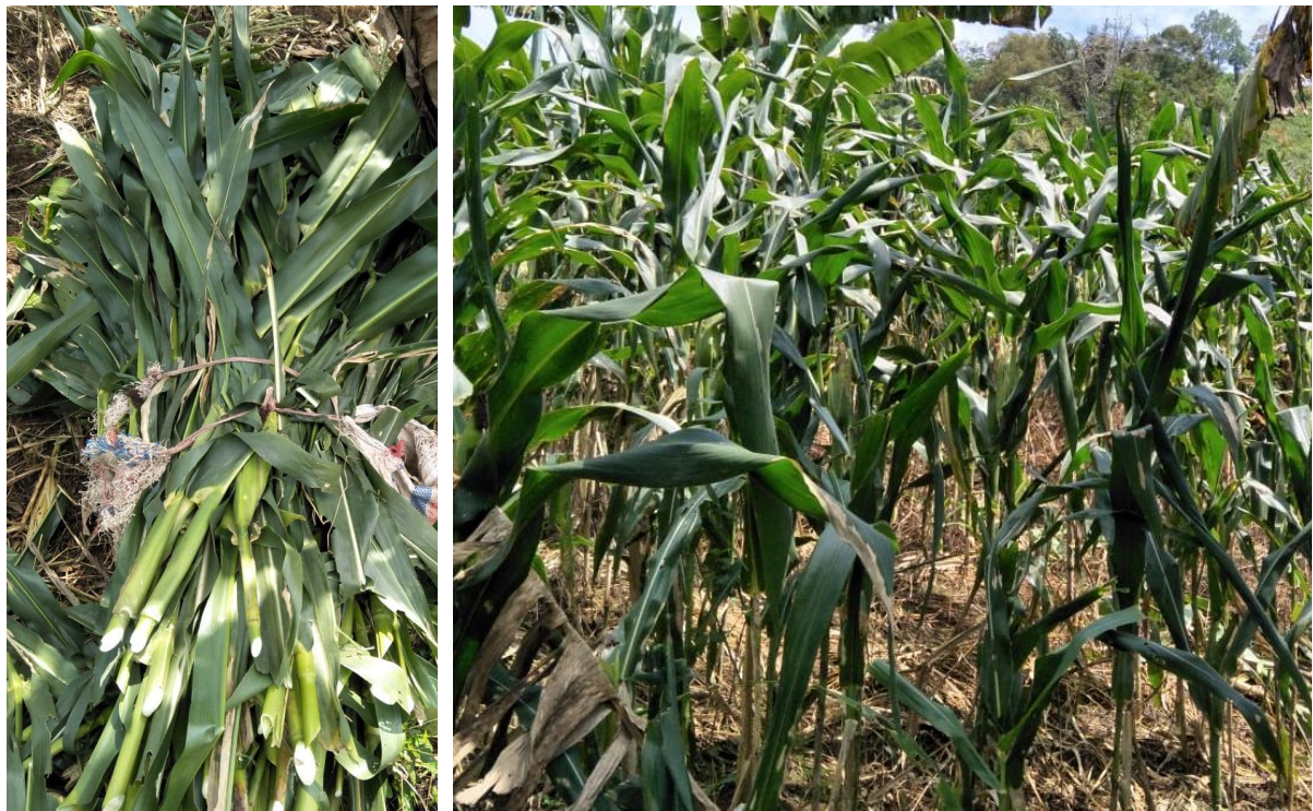
Gambar 4. Jerami Jagung